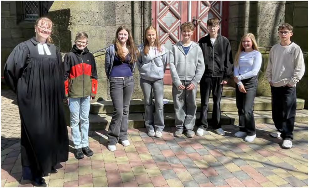
Der von den Konfis gestaltete Vorstellungsgottesdienst zum Thema Fußball