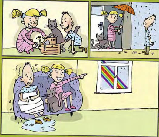
Mit einem Regenbogen