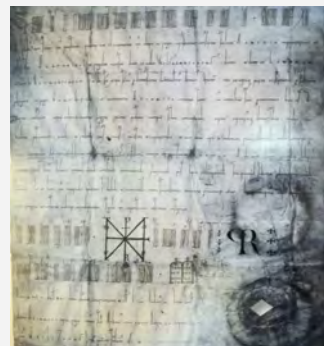
Kopie der Urkunde