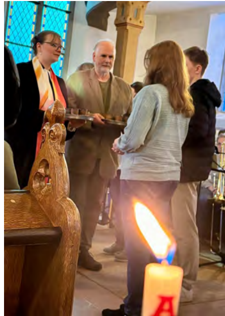
Osternacht in der Kirche Dreihausen