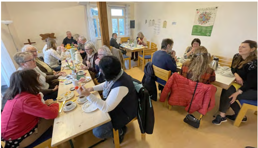
Gemeinsames Frühstück nach der Osternacht