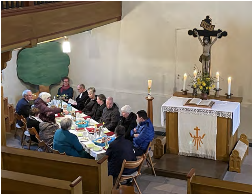
Abendmahl und Abendessen am Gründonnerstag in der Kirche Heskem