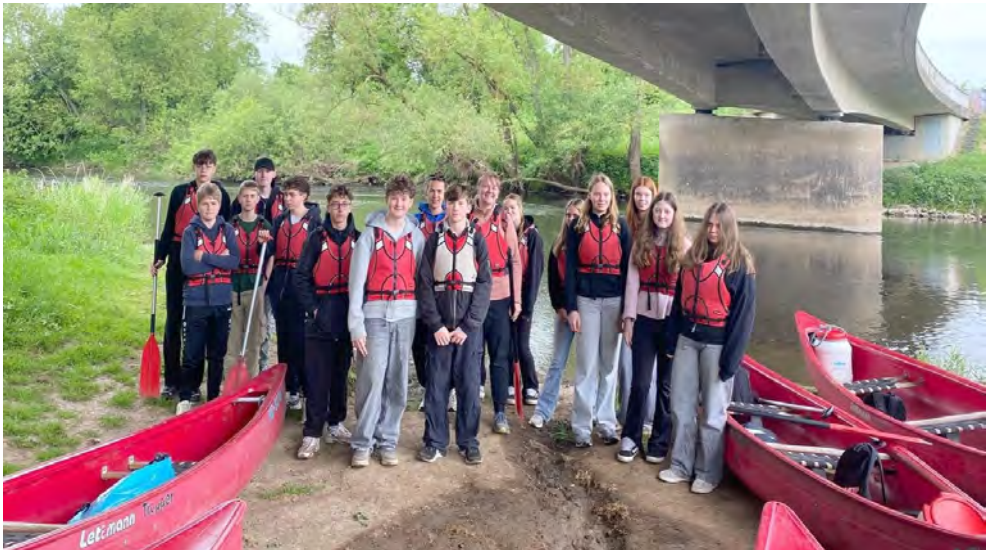
Kanufahrt auf der Lahn