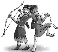
Jonathan und David

Die ganze Gemeinde ist eingeladen, den Familiengottesdienst zum Abschluss der Kinderbibeltage am 19. April , Kirche Moischt, mitzufeiern!